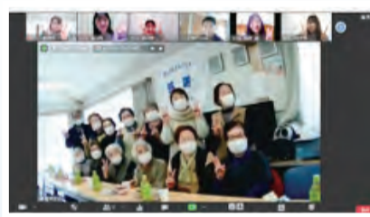
閉上中央町内会集会所で住民の皆さんと「ハイッ、仙台名物」「ずんだもちい〜」