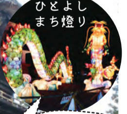
ひとよしまち燈り

今から1200年前に創立された国内最南端の国宝建築物。「人吉ひかり復興計画」としてライトアップもされていました。