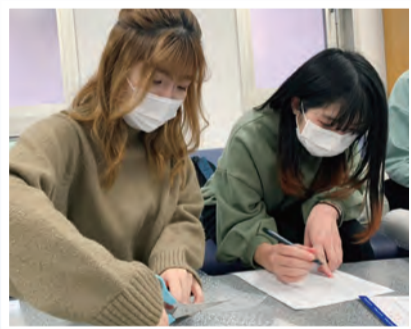
お手紙を添えて長野に送ります