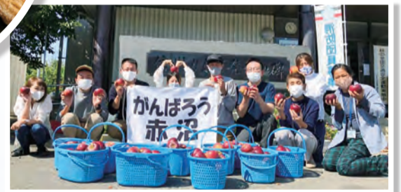
災害の翌年は、過去最高量のりんごの収穫がありました！