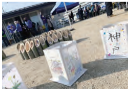
3.11の集会で並べられた絵灯籠