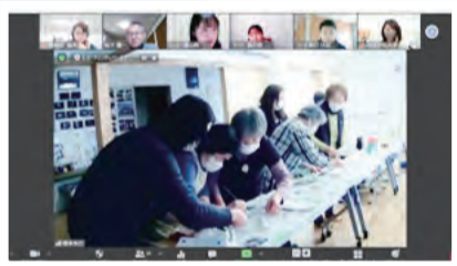
神戸・宮城の学生が作成した絵を閉上中央町内会集会所で組み立ててくださっています