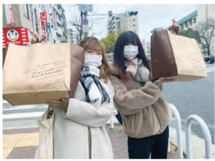
何回も通ってやっとできた！