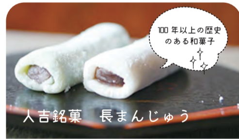
人吉銘菓 長まんじゅう