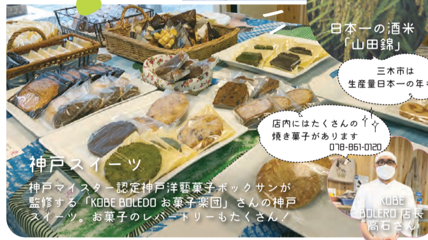
日本一の酒米「山田錦」