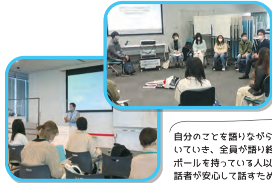
コミュニティボール

内容：「人と防災未来センター」を見学した後、「p4c (philosophy for children)」という哲学の探求手法を用い、「復興と防災」「死と折り」「記憶と未来」をテーマに対話活動を行い、「災害を学ぶこと・伝えること」について考えました。