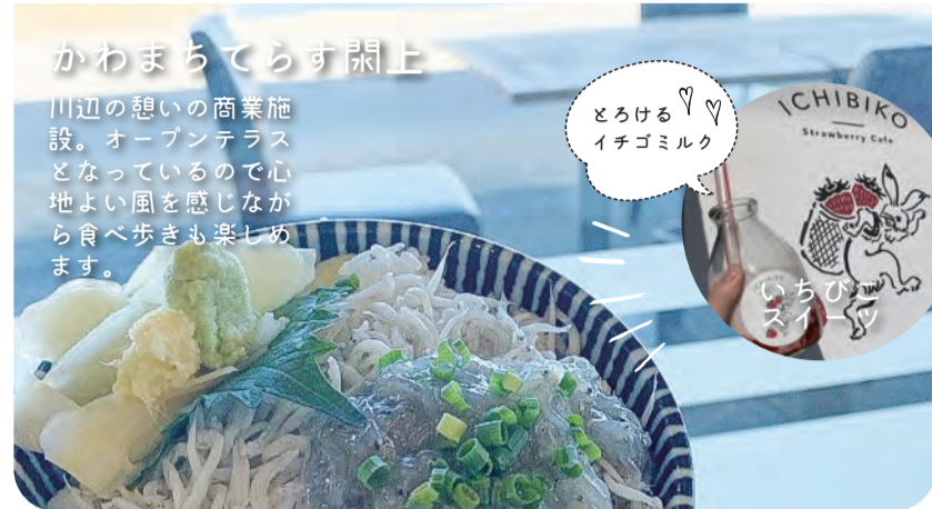
かわまちてらすうどん

川辺の憩いの商業施設。オープンテラスとなっているので心地よい風を感じながら食べ歩きも楽しめます。