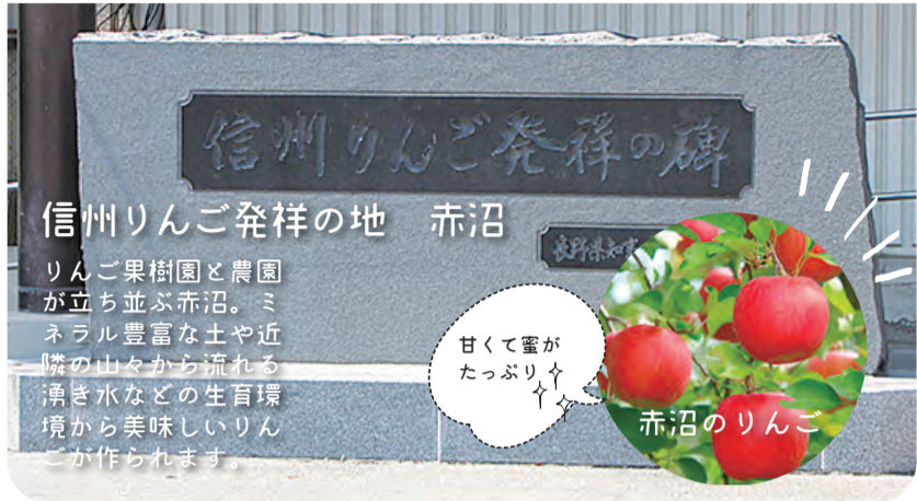
信州りんご発祥の地 赤沼

りんご果樹園と農園が立ち並ぶ赤沼。ミネラル豊富な土や近隣の山々から流れる湧き水などの生育環境から美味しいりんごが作られます。